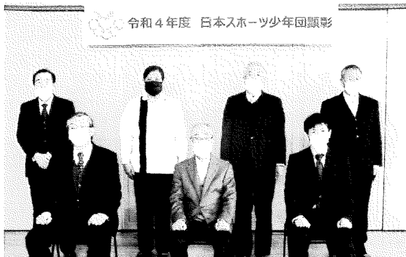
日本スポーツ少年団顕彰受賞者