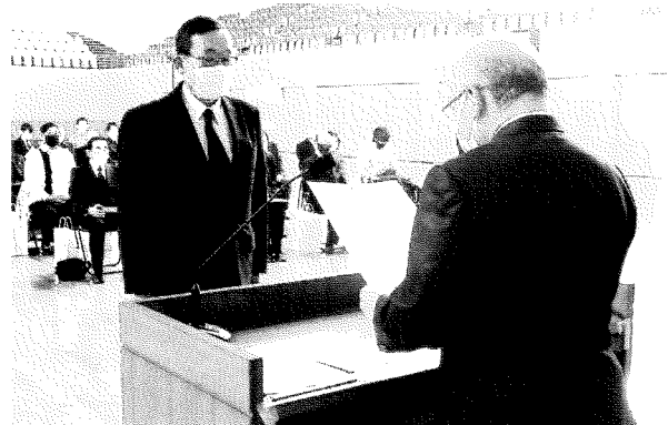
群馬県スポーツ少年団顕彰表彰式